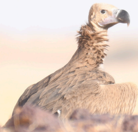
Photo : Un vautour oricou dans le massif du Termit, où 24 individus ont été recensés lors de la dernière mission sur le terrain, dont cinq juvéniles nés cette année. La région est connue pour être l'un des principaux sites de reproduction de l'espèce au Niger.

15 000 personnes touchées par les actualités de notre programme sur les réseaux sociaux