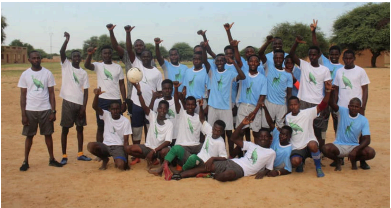
Photo: Deux équipes de football, les Vautours et les Girafes, se sont affrontées lors d'un match entre l'Unité de gestion de la RBG et des jeunes des communes voisines. Cette activité a permis de les rassembler, créant des opportunités de dialogue.

Date : octobre 2025.