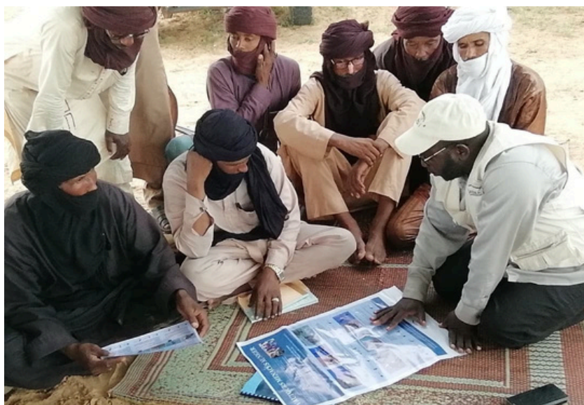
Photo : L'équipe au Niger organisant une séance de sensibilisation avec les membres de la communauté locale, principalement des éleveurs, afin de présenter les différentes espèces de vautours, leur rôle et leur écologie. Cette activité vise à améliorer la compréhension et à promouvoir des attitudes positives envers ces espèces, afin de soutenir leur conservation.

Merci à l'ensemble des membres de l'équipe pour leur participation et leur soutien, ainsi qu'aux autorités et aux communautés qui contribuent à faire de cette initiative un succès.