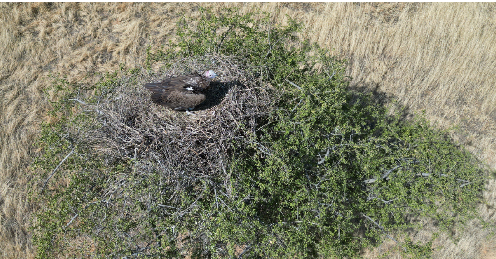
Photo: Un vautour oricou en incubation dans la RFOROA. Le suivi des nids est effectuée en continu pendant la saison de reproduction afin de suivre les différentes étapes et d'évaluer le succès de la reproduction.

Date : décembre 2025